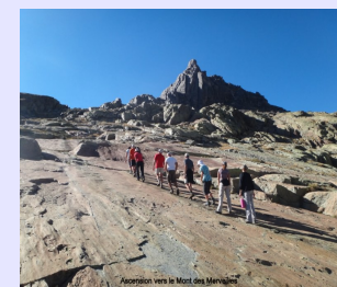
Apperçion vers le Mont des Merveilles