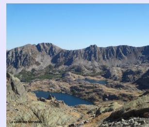
La vallée des Merveilles

Nuitée, dîner et petit déjeuner au Refuge Merveilles