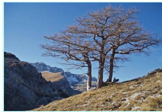
Mélèzes des Merveilles

Durée : 7h00 / D+ : +1150m / D- : -1480m / 17km